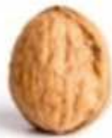
ch = ł