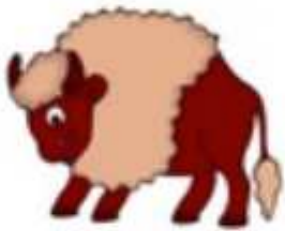
zon = a