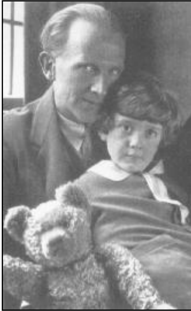
A.A. Milne ze swoim synem Krzysiem